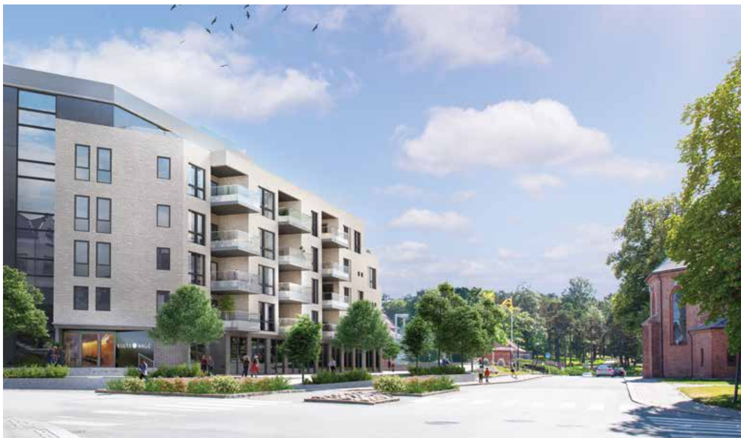
LYST OG LUFTIG: Med Kulåsparken som nabo og rekreasjonsområde blir Kulås Hage et sted beboerne blir stolte av å høre til. Illustrasjon: Blår.

Hittil har allerede halvparten av boligene fått sin nye eier, og i løpet av to år står alle leilighetene fiks ferdig.