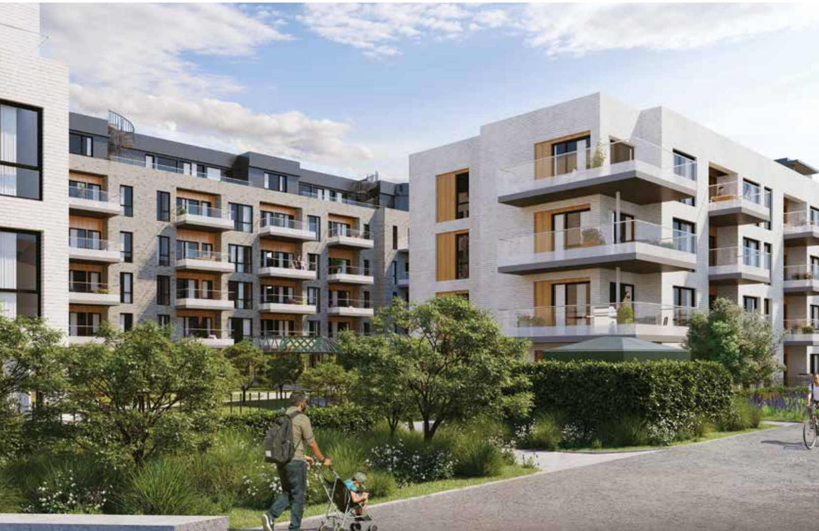
HAGEN: Her ser man hvordan hagen blir kjernen i kvartalet. Illustrasjon: Blår.

ønsket om å innfri og gjøre kundene mer enn gjennomsnittlig fornøyde sitter dypt.